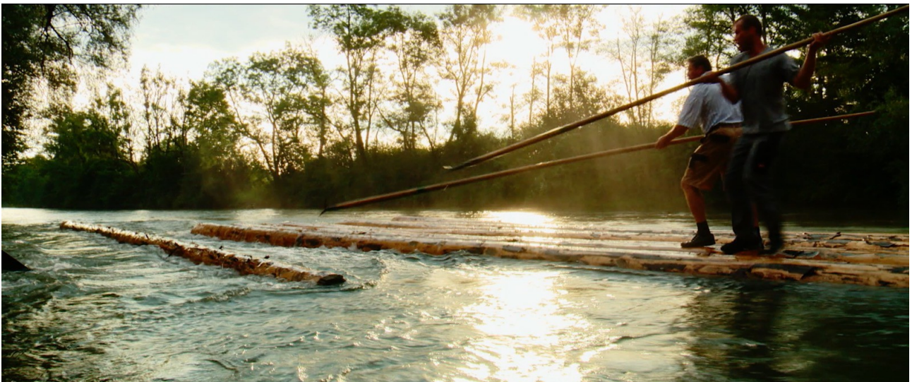
Szene aus „Fahr ma obi am Wasser“

Der Kino-Dokumentarfilm FAHR MA OBI AM WASSER von Walter Steffen zeigt beeindruckende Bilder des uralten Flößer-Handwerks auf Isar und Loisach im bayrischen Oberland. Die Uraufführung findet auf dem Filmfestival Bozen statt, die Deutschlandpremiere auf dem DOK.fest München. Kinostart ist am 11. Mai 2017.